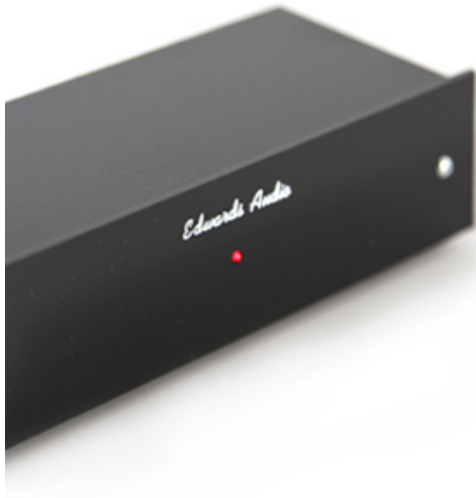
Apprentice MM V2 Phonovorverstärker Moving Magnet