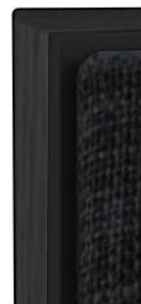
Noyer American Walnut