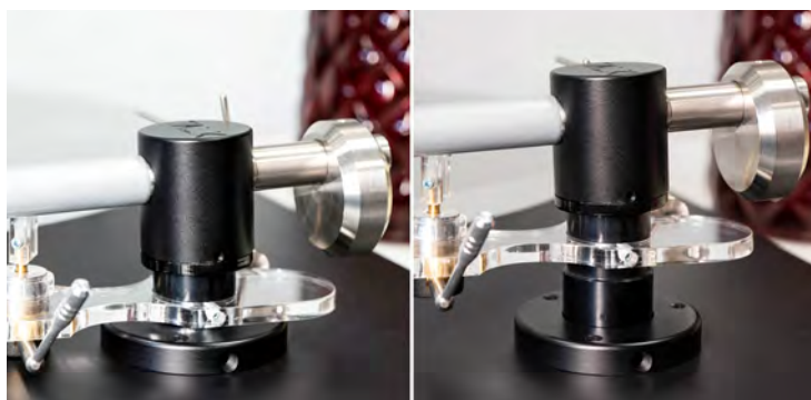
Die Tonarmaufnahme lässt sich in der Höhe verstellen. Dank des VTA kann der perfekte Eintauchwinkel für nahezu jede Schallplatte eingestellt werden.

Ganz praktisch geschieht die Höhenverstellung des Tonarms an der Tonarmbasis: Hier befindet sich seitlich eine kleine Inbus-Schraube, die den Tonarm in seiner Höhe arretiert. Löst man diese Schraube, kann der Tonarm in der Höhe verschoben werden. Über diese Höhenverstellung wird am anderen Ende des Tonarms der sogenannte „VTA“ eingestellt. Der Vertical Tracking Angle ist der Winkel unter dem die Nadel in die Schallplattenrinne eintaucht. Dieser sollte möglichst senkrecht sein. Darum ist der kleine Abtastdiamant so am Nadelträger befestigt, dass der Winkel stimmt, sobald sich der Tonarm genau parallel zur Schallplattenoberfläche befindet. Klingt kompliziert, ist aber ganz einfach. Stimmt der Winkel nicht, so kann sich die Klangbalance verschieben. Ein zu tief eingestellter Tonarm soll etwas mehr Bass und weniger Höhen bedingen. Ein zu hoch eingestellter bewirkt exakt das Gegenteil. Ob es stimmt, das habe ich ehrlich gesagt nie ausprobiert.