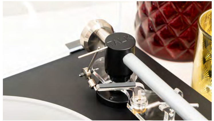
Selbst an eine Anti-Skating-Lösung hat Edwards Audio bei der Entwicklung des TT5 gedacht.

Pausen zwischen zwei Titeln auf. Viel eher stehen Schallplatten und auch der TT5 für natürlichen und organischen Klang. Es klingt ebenso wohligh und natürlich, wie man es auch von echten Instrumenten und Musikern gewohnt ist und weniger technisch als es bei digitaler Wiedergabe manchmal der Fall ist. Kehrseite der Medaille ist, wenn man es denn so ausdrücken möchte, dass das letzte bisschen Auflösung und die feinsten Details bei der Platte manchmal etwas auf der Strecke bleiben.