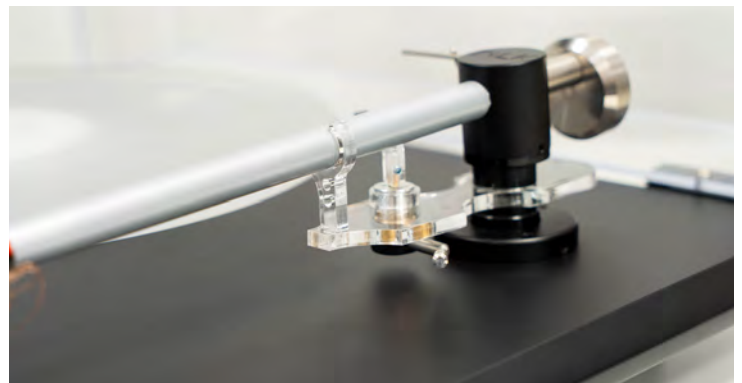
Der Tonarm EA5 stammt von Edwards Audio und misst 9 Zoll.

Nach dem Teller und Antrieb beschrieben sind, komme ich zum Tonarm mit der Bezeichnung EA5. Dabei handelt es sich um den ersten selbst entwickelten Tonarm des Herstellers. Das kleine Plattenspieler-Modell TT Lite ist noch mit einem Tonarm aus dem Rega Baukasten bestückt, für den hochwertigen TT5 wollte man nun jedoch auf einen eigenen Tonarm setzen. Der scheint auf den ersten Blick ein voller Erfolg zu sein. Der EA5 ist als klassischer 9-Zoll-Arm konstruiert. Damit ist die Länge des üppig dimensionierten Aluminium-Tonarmrohrs gemeint. Die Länge von gut 230 Millimetern entspricht dem Standard. Ganz günstige Plattenspieler haben manchmal kürze Arme, besonders hochwertige hingegen bis zu 12 oder in Ausnahmefällen sogar 14 Zoll. Dadurch verringert sich zwar der Spurfehler, der entsteht weil der Tonabnehmer im Halbkreis über die Schallplatte geführt wird, man handelt sich jedoch andere Nachteile wie hohe Tonarmmasse und große Abmessungen des Plattenspielers ein.