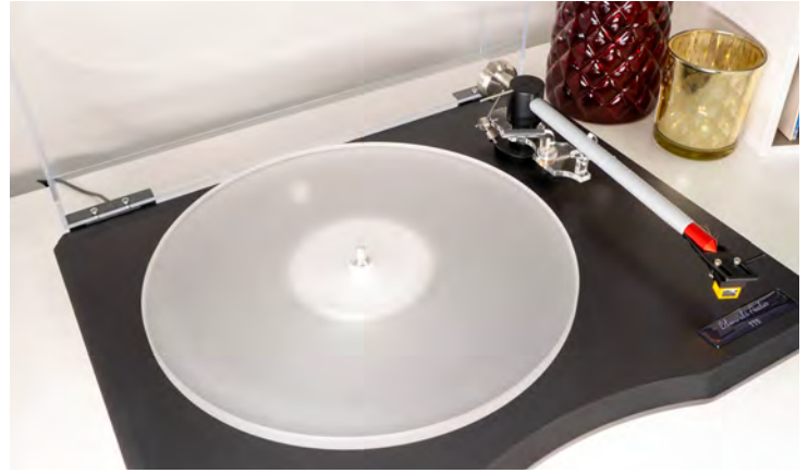
Der gut 900 Gramm schwere, elf Millimeter starke Teller ist hübsch gestylt und perfekt gearbeitet.

Das heißt: Das mitgelieferte Steckernetzteil stellt eine gleichmäßige Wechselspannung zur Verfügung, an dessen Frequenz sich die Drehzahl des Motors bemisst. Damit liegt der Vorteil dieses Konzepts auf der Hand: Denn stimmt die Frequenz, so stimmt auch die Motordrehzahl. Und damit auch die Tellerdrehzahl exakt mit dem Soll von 33 bzw. 45 Umdrehungen pro Minute überein. Eine