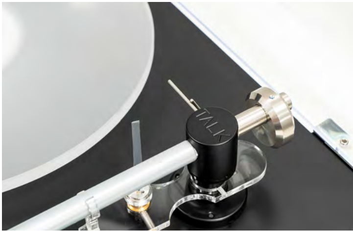
Gemessen an seinem niedrigen Preis ist der TT5 in jedem Detail vorbildlich verarbeitet.