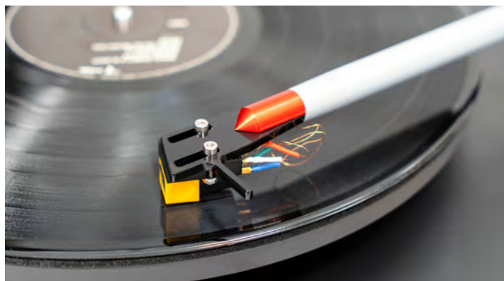
Für unseren Test haben wir den TT5 mit einem Zephyr C 200 bestückt.

Unstrittig ist jedoch, dass sich durch einen falsch eingestellten Winkel die Abtastverzerrungen erhöhen und das wollen wir definitiv nicht. An unserem Testexemplar ist der Tonabnehmer Talk Zephyr C200 montiert. Wie das Lager kauft Edwards auch den Tonabnehmer von einem Spezialisten zu. Ist der VTA mit dem C200 korrekt eingestellt, so bemerkten wir bei unserem Testgerät, dass