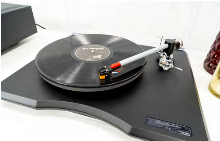
Der Edwards Audio TT5 ist modern gestylt, drängt sich optisch aber nicht in den Vordergrund.