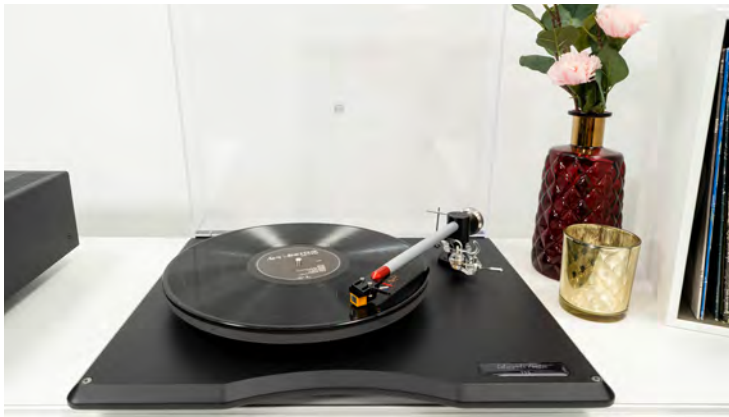
Der Edwards Audio TT5 begeistert im Test durch seinen wunderbar runden und analogen Klang.