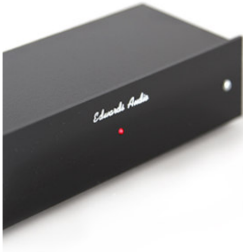
Apprentice MM V2 Phonovorverstärker Moving Magnet