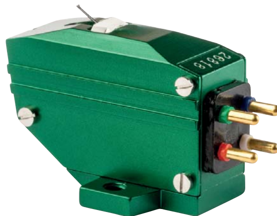
Für Generator und Magnetsystem kommen Elemente aus der Grasshopper-Familie zum Einsatz

Was die Masse des Systems angeht, ist man trotz des Metallbodys nicht so weit entfernt von der der offenen Systeme, die die fehlende Hülle mit einem recht massiven Träger ausgleichen.