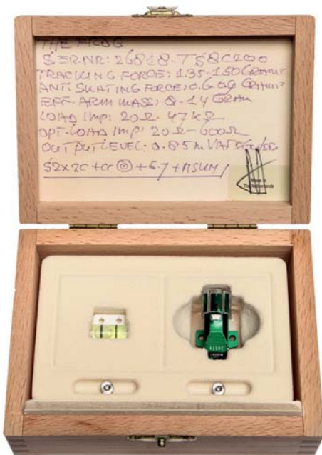
Wie immer bei Tonabnehmern des Altmeisters: Holzschatulle mit handschriftlich eingetragenen technischen Daten

Mit den Tieren hat es Altmeister van den Hul ja schon: Seine Top-Systeme sind zumeist dem flatternden Gefieder gewidmet, während die „kleineren“ Tonabnehmer dann schon eher bodenständig sind. Nun, ein Frosch ist immerhin in der Lage, weit und hoch zu springen