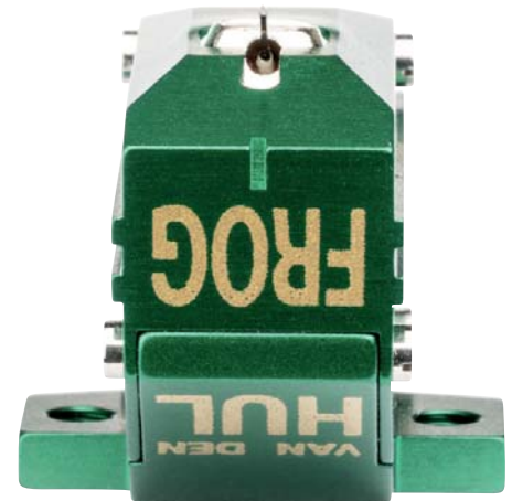
Neben der Version gibt es noch Varianten mit Kupferspulen, darunter sogar ein waschechtes High-Output-MC