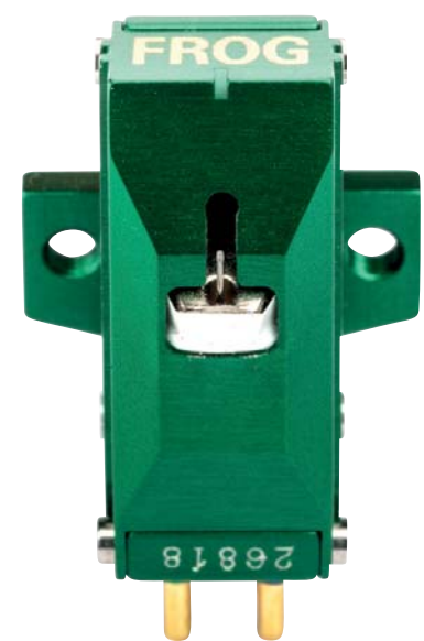
Der bolzengerade eingesetzte Nadelträger ist deutlich kürzer als bei anderen Systemen