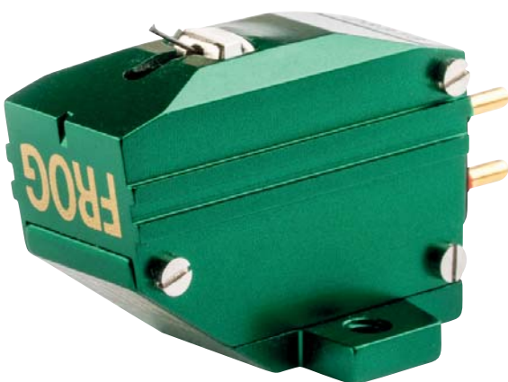
Das Frog Gold ist das hochwertigste Van-den-Hul-System, das noch ein geschlossenes Gehäuse bekommt

Damit kommen wir rechnerisch auf eine Compliance, die bei etwa 25 Millimetern pro Newton oder sogar darunter liegen dürfte – gegenüber den 35, die beispielsweise ein Test-Canary hatte, ist das deutlich härter, aber eben auch praxisgerechter, was die heute handelsüblichen Tonarme angeht. Sogar mit meinem SAEC WE 407/23 ist das Frog ganz vorzüglich klar gekommen, eine weise Entscheidung also.