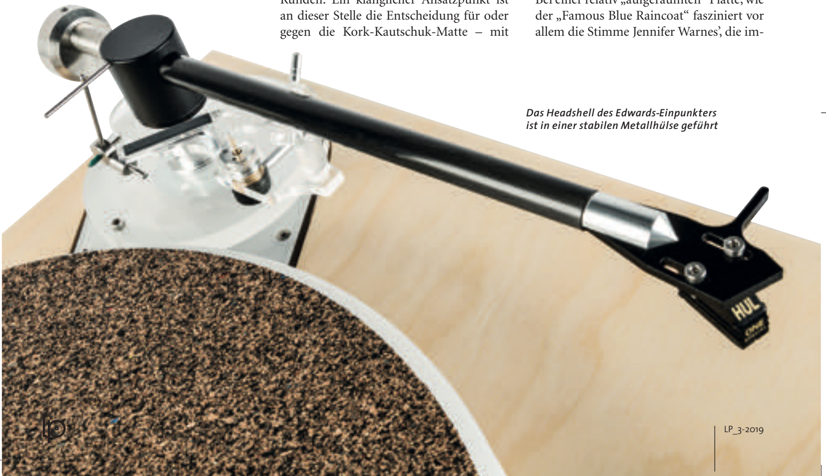
Das Headshell des Edwards-Einpunkters ist in einer stabilen Metallhülse geführt

Bei einer relativ „aufgeräumten“ Platte, wie der „Famous Blue Raincoat“ fasziniert vor allem die Stimme Jennifer Warnes', die im-