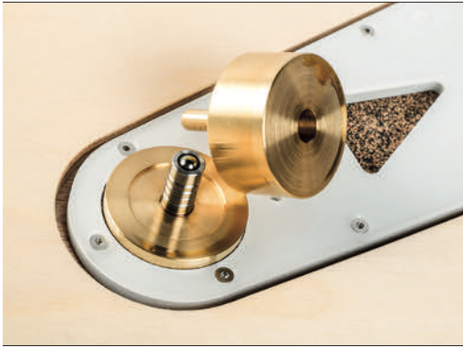
Das Tellerlager besteht hauptsächlich aus Messing – die Achse selbst ist natürlich aus Edelstahl

und entsprechender Lagerpfanne. Der Arm ist aber im Lagerpunkt so eng geführt, dass man keine Sorgen um die Nadel haben muss, selbst wenn man wirklich heftig gegen den Plattenspieler stoßen würde. Ausbalanciert wird der Arm wie üblich durch die Position des Gegengewichts. Das Antiskating wird nicht über Gewicht und Faden, sondern über einen Ausleger mit Stange und Hebel realisiert – bei Bedarf kann man die Stange auch wegklappen und arbeitet ohne Antiskating. In einer Acrylplatte sind Lift und die Klemmung des Arms eingelassen, der an dieser Stelle auch in der Höhe verstellt werden kann. Das Kohlefaser-Armrohr mündet in einem Headshell aus Acryl mit einer Halterung aus Metall für mehr Stabilität.