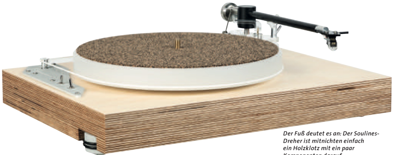
Der Fuß deutet es an: Der Soulines-Dreher ist mitnichten einfach ein Holzklötz mit ein paar Komponenten darauf

aus Kork und Kautschuk. Damit handelt es sich beim Träger von Tonarm und Teller um ein minimal schwingendes Subchassis, das schädliche Resonanzen minimiert. Das Tellerlager besitzt eine stehende Edelstahlachse mit eingepresster Kugel. Der Träger der Achse und die Lagerbuchse bestehen aus Messing. In der Achse wie in der Buchse sind Taschen eingeschliffen, die ein Reservoir für das Lageröl bilden und somit für eine permanente und konstante Schmierung sorgen.