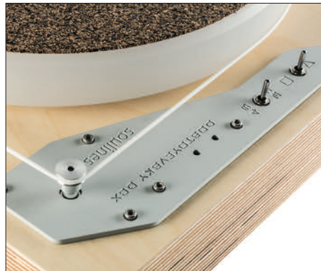
Ein sehr weicher Riemen treibt den 30 Millimeter starken Acrylteller an