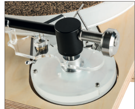
Zum Lieferumfang des Dostoyevsky gehören immerhin drei verschiedene Tonarmbasen

Bereits im letzten Test eines Soulines-Plattenspielers haben wir es ja schon erwähnt: Die serbischen Laufwerke entstehen zunächst in einer aufwendigen Simulation auf dem Rechner. Das bedeutet, nicht nur die Konstruktionszeichnungen an sich, sondern auch die Berechnung der Masseverhältnisse in einem Laufwerk und sogar die Materialstruktur.